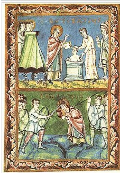
St. Bonifatius, het H. Doopsel toedienend (boven) en zijn marteldood (onder), uit het Sacramentarium van Fulda (ca. 975)

De verhalen over Bonifatius zijn deels gebaseerd op vitae of heiligenverhalen . Geschiedkundige realiteit en fictie lopen hierin door elkaar: een vita is nooit een objectieve historische bron, maar wel een cultuurhistorische. Over Bonifatius zijn minstens vier vitae geschreven. Het doel van de schrijvers was verbreiden en versterken van het geloof. Door de martelaarsstatus kon Bonifatius heilig worden verklaard. Dat Bonifatius zich met een boek tegen zijn belagers beschermde, is pas in een latere vita beschreven.