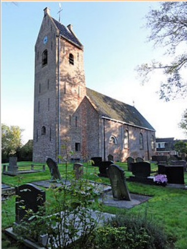
Mariakerk van Foudgum anno 2010