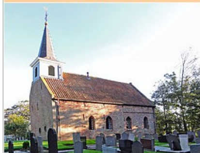
Mariakerk van Bornwird anno 2010