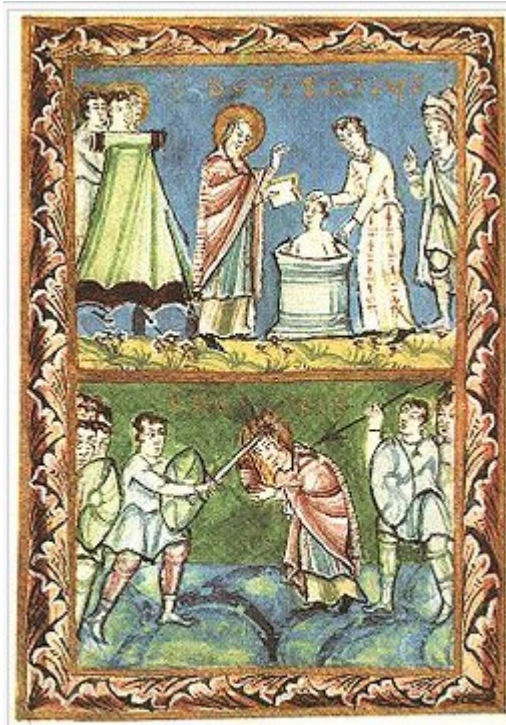
St. Bonifatius, het H. Doopsel toedienend (boven) en zijn marteldood (onder), uit het Sacramentarium van Fulda (ca. 975)

De verhalen over Bonifatius zijn deels gebaseerd op vitae of heiligenverhalen . Geschiedkundige realiteit en fictie lopen hierin door elkaar: een vita is nooit een objectieve historische bron, maar wel een cultuurhistorische. Over Bonifatius zijn minstens vier vitae geschreven. Het doel van de schrijvers was verbreiden en versterken van het geloof. Door de martelaarsstatus kon Bonifatius heilig worden verklaard. Dat Bonifatius zich met een boek tegen zijn belagers beschermde, is pas in een latere vita beschreven.